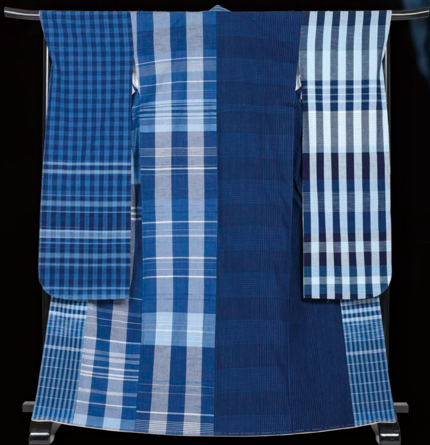
作家5名による集大成